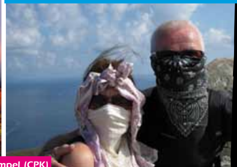
Ich und meine Gespielin vor dem Aufstieg (CPK)

Es sollte die Expedition zum Ruhme unserer Stadt werden! Senator Jörg Stingl plante ursprünglich die Besteigung des Fuji in Japan. Da er aber befürchtete, die Region um Japans heiligen Berg überstrahlt seinen Ruhm als Bergsteiger, orientierte er sich kurzfristig um und verband einen son-nigen Italienurlaub mit der Besteigung des Vulkans Stromboli im Tyrrhenischen Meer. Wahrscheinlich zwischen zwei Pizzen. Im Vorfeld hatte sich der Bürgermeister unserer Stadt zur