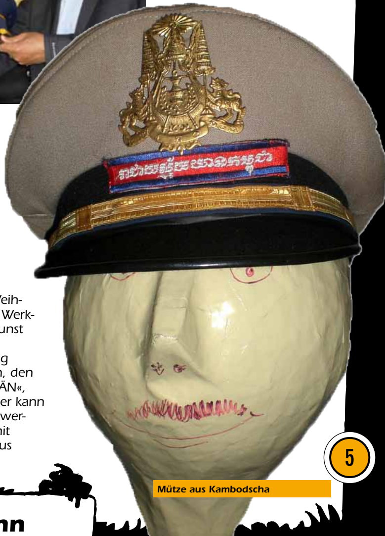
Mütze aus Kambodscha