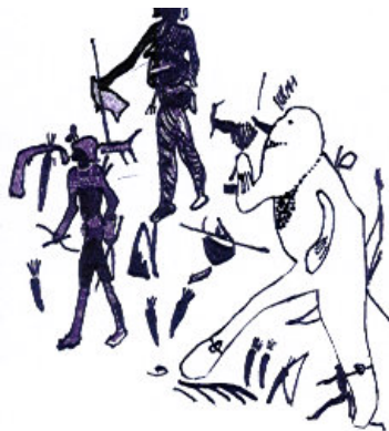
Abb. 1 Wers glaubt....

Eine meiner ersten Reisen führte mich in das südliche Hochafrika, die Heimat der Buschmänner, Bergdama und anderen bantusprachigen Völkern. Da ihr Lebensraum wegen extremer Trockenheit für den Ackerbau nicht recht geeignet war, bildete die Ernährungsgrundlage die Jägerei oder auch die Zucht von Rindern und Fettschwanzschafen. Die Letzteren sehen recht lustig aus. Aber darum geht es ja nicht. In den kurzen Pausen des Nomadenlebens verschönerten sich die