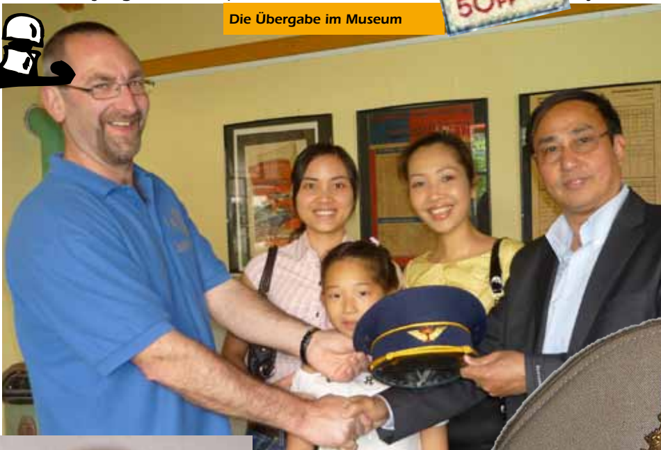
Die Übergabe im Museum