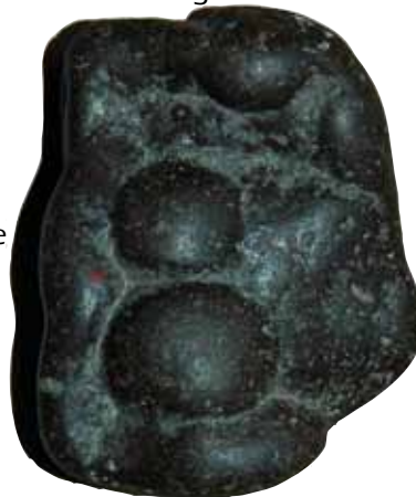
Abb. 4 Stoneman (4,8cm hoch)

Offensichtlich etwas zu tief, die Schaufel verschwand im nachgebenden Wüstensand. Ich sofort hinterher und plötzlich fand ich mich in einer bisher unbekanntem Grabkammer wieder. Als sich die Augen ans Schummerlicht gewöhnt hatten, fielen sie vor Staunen auch fast aus den Höhlen (des Kopfes/Anm. der Red.). Jungfräulich waren einzigartige Zeichnungen ägyptischer Göttergestalten an den Wänden der Grotte erhalten. Abb.3 Die von mir gefertigten Kopien möchte ich der Leserschaft nicht vorenthalten, die Lage der Grabkammer gebe ich aber auch unter Folter nicht preis! Hier wartet ein weites Forschungsfeld auf mich.