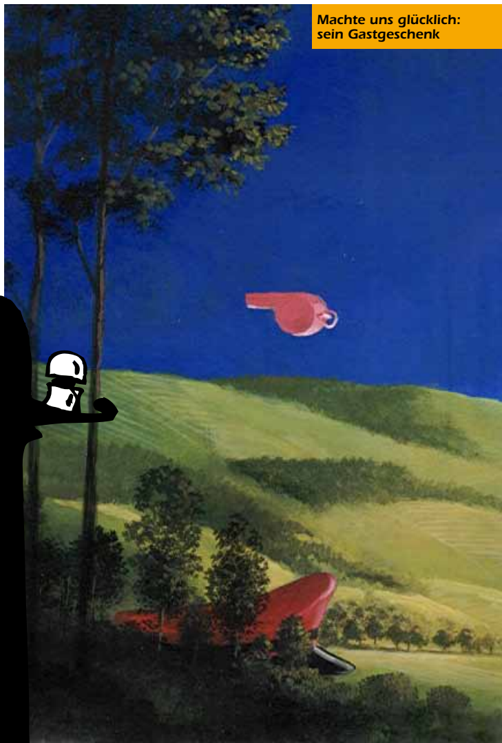
ABENDWOLKE ÜBER GROSSMÜTZENAU MIT HERZLICHEN GRUSS G. GLÜCK 3.9.2011